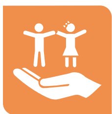
Derechos de las niñas y los niños