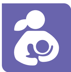
Lactancia materna y alimentación