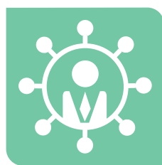
Servicios de atención