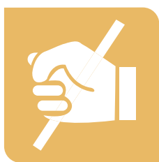
Prevención maltrato infantil