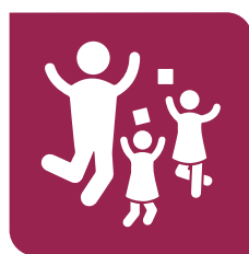
Juego y esparcimiento