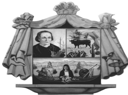
PRESIDENCIA MUNICIPAL COLÓN, QRO.