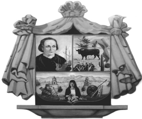
PRESIDENCIA MUNICIPAL COLÓN, QRO.